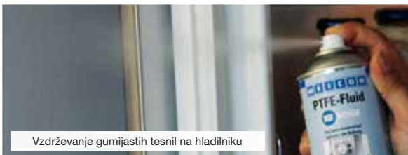
Vzdrževanje gumijastih tesnil na hladilniku