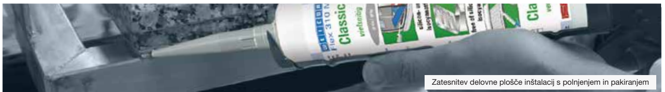
Zatesnitev delovne plošče inštalacij s polnjenjem in pakiranjem