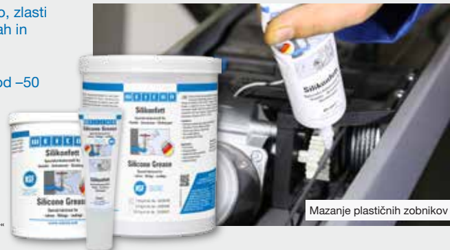
Mazanje plastičnih zobnikov

Preizkušeno po BAM in varnost, ovrednotena v skladu z navodili M 031-1 »Seznam nekovinskih materialov, združljivih s kisikom« (informacije DGVU 213-078) BG RCI