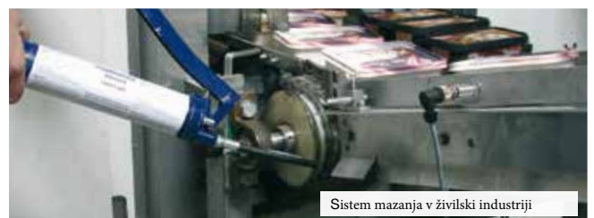
Sistem mazanja v živilski industriji

Zato je pomembno izpolnjevati zahteve za dolgoročno operativno zanesljivost naprav in opreme, ki so že v fazi razvoja in gradnje.