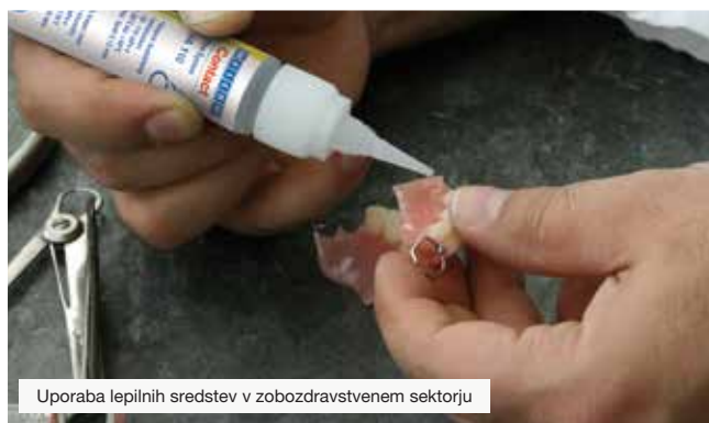
Uporaba lepilnih sredstev v zobozdravstvenem sektorju