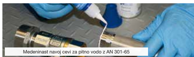
Medenast navoj cevi za pitno vodo z AN 301-65

Po sušenju je lepilna vez odporna proti vibracijam, udarcem, kemikalijam, toplom in temperaturam od -60 °C do +150 °C (-76 °F do +302 °F).