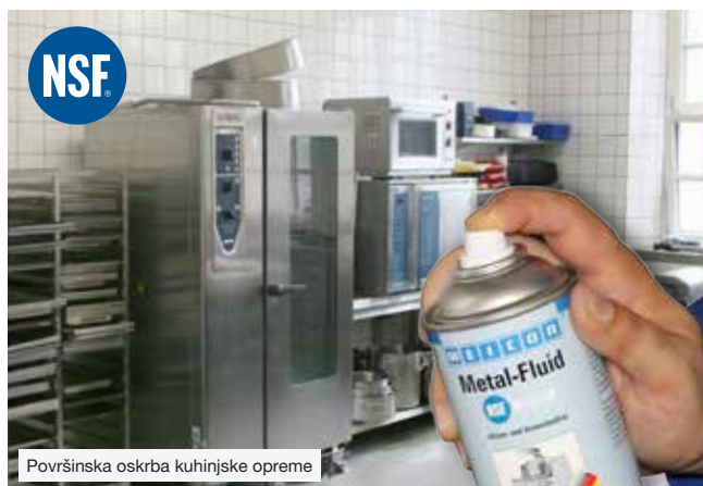
Površinska oskrba kuhinjske opreme

Ti izdelki se lahko uporabljajo na občutljivih področjih, kot so proizvodnja hrane, industrija hrane in pijač ter farmacevtska in kozmetična industrija. Tu se lahko naša lepila in tesnilne mase, montažne paste ali čistila uporabljajo na različnih proizvodnih področjih.