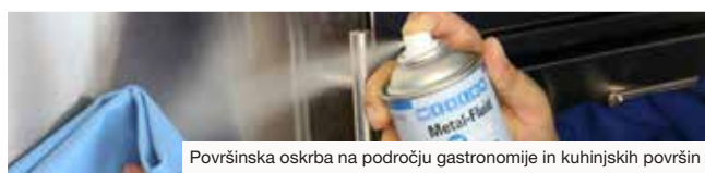
Površinska oskrba na področju gastronomije in kuhinjskih površin

Uporabljajo se za nego in zaščito površin, za čiščenje in razmaščevanje, mazanje, sproščanje in ločevanje ter so bistveni element dela.