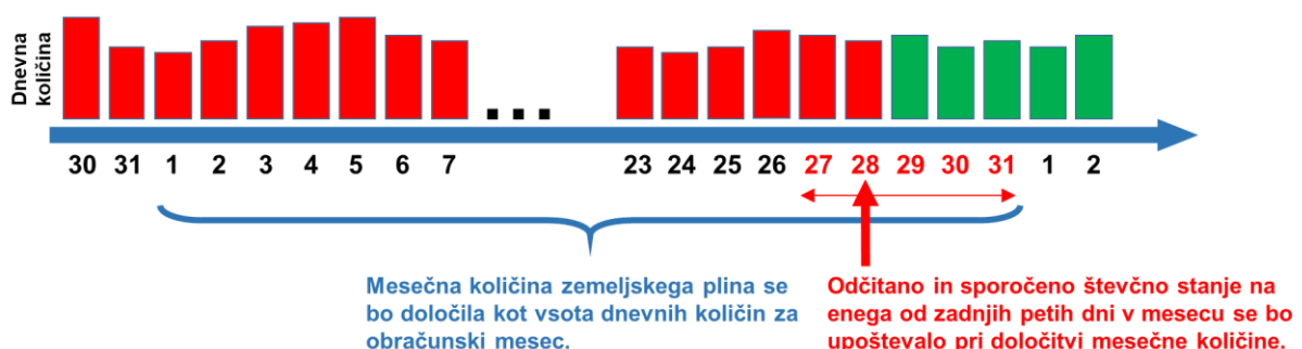
Shema 2: Poenostavljeni prikaz uporabe metodologije za določitev količine zemeljskega plina po obremenitvenem profilu in z upoštevanjem odčitka števčnega stanja

Cilj metodologije je, da se ocenjena poraba zemeljskega plina približa dejanski porabi, večje spremembe pri določanju količin glede na dosedanje metode določanja niso predvidene. Z uporabo nove metodologije bodo dobavitelji na dnevni ravni razpolagali z bolj točno informacijo o porabi njihovih odjemalcev. Pri določitvi mesečne količine zemeljskega plina se bo kot doslej še naprej upoštevalo tudi vsako odčitano in sporočeno števčno stanje, ki ga bo odjemalec sporočil operaterju distribucijskega sistema ali dobavitelju ali pa ga bo v okviru popisov odčital operater distribucijskega sistema (Shema 2).